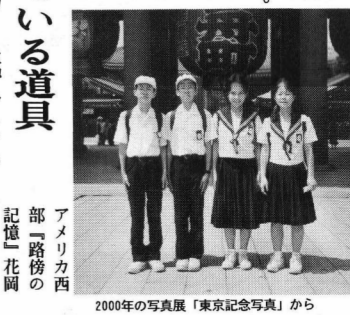
2000年の写真展「東京記念写真」から