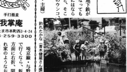
トンボ公園でザリガニつり

7月10日、トンボ公園で南小の1年60名がザリガニつりを体験。一人20匹を釣った。