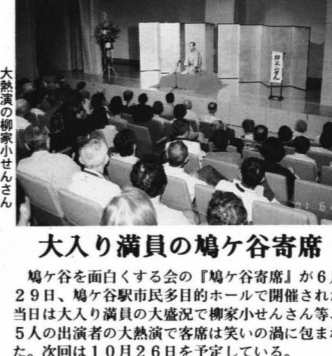
大入り満員の鳩ヶ谷寄席

「おしゃべり談話室」は、おしゃべり好きな人たちの集まり。おしゃべり好きな人たちの集まり。おしゃべり好きな人たちの集まり。