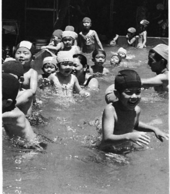
プール遊びは楽しいな

NHKラジオ体操が鳩ヶ谷にやってくる 8月12日鳩ヶ谷高校グラウンドに大集合 埼玉高速鉄道の開通を記念して「NHK夏期ラジオ体操」が、鳩ヶ谷高校グラウンドに大集合で行われる。今年も、ラジオ体操の普及を目的として、鳩ヶ谷高校グラウンドに大集合で行われる。