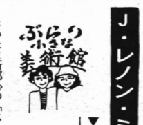
「おしゃべりじゃ〜なる」

60歳で年寄り扱いはやめて 「おしゃべりじゃ〜なる」 「おしゃべりじゃ〜なる」 「おしゃべりじゃ〜なる」