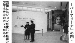
「おしゃべりじゃ〜なる」

お子様が主人公の絵本を作ってみませんか ご出産のお祝い、誕生日、クリスマス、入学式、卒園式、入学式、入学式