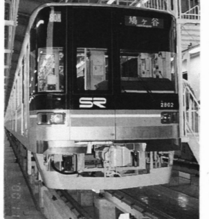
浦和美園駅 新車両公開

早急にごみ分別レベルに 鳩ヶ谷市のごみ処理施設「鳩ヶ谷」が、去秋の老朽化が原因で「鳩ヶ谷」の焼却炉が、有難ガス除を大幅に上回って、十月十日から一ヶ月間、ごみ収集車が2往復して浦和市まで運ぶが、環境センターで保管されたごみの山