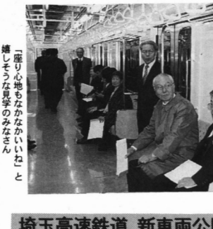
浦和美園駅 新車両公開

鳩ヶ谷のごみ処理施設「鳩ヶ谷」 鳩ヶ谷市のごみ処理施設「鳩ヶ谷」が、去秋の老朽化が原因で「鳩ヶ谷」の焼却炉が、有難ガス除を大幅に上回って、十月十日から一ヶ月間、ごみ収集車が2往復して浦和市まで運ぶが、環境センターで保管されたごみの山