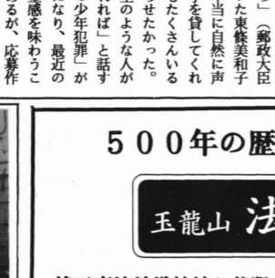
鳩ヶ谷市民短歌会