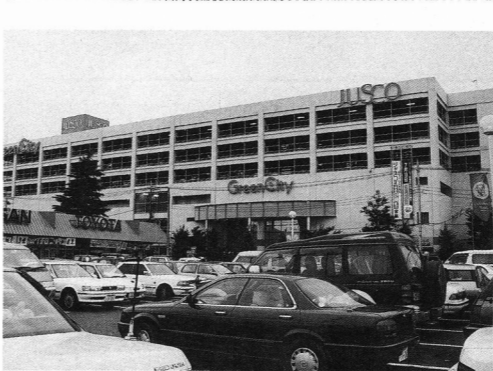
資生堂化粧品などのディスカウントを始めたジャスコ。ディスカウントストアとの競争も激しくなっている。