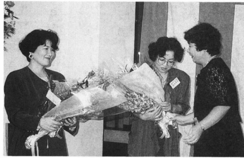
写真はたぐさんの花束を貰って、感激する二人

編集と発行 富田栄子&上田真由美 鳩ヶ谷市桜町2-9-5 ☎(0482)85-6208 発行日 2,4,6,8,10,12月の年6回 発行部数 10,000部(無料配布)