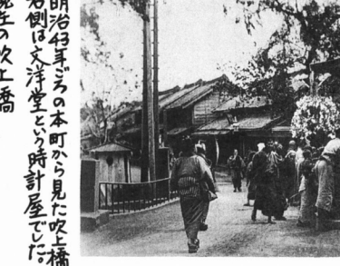
↑見沼代用水の宮下橋附近