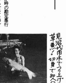
見沼代用水で遊ぶ