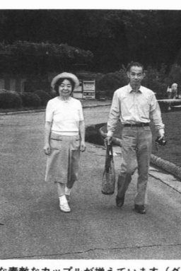
こんな素敵なカップルが増えています(グリーンセンターで)

★夫婦の会話がありますか (ある94人、ない6人) 20分以内 .....10% 30分 .....26% 1時間 .....31% 2時間以上 .....23% 回答なし .....10%